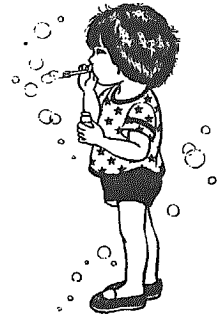
イラスト 木津中 永木美佳子

※氏名は、常用漢字を使用していますので、戸籍上の字体と異なる場合があります。 ただし、出生したお子さんの名前は、戸籍上の字体を使用しています。 ※掲載を希望されない方は、届出の際に住民課窓口までお申し出下さい。