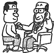
成人病予防週間 (2月1~7日)

相談員がことばや、発達のおくれ等について相談に応じます。 気軽においでください。 午前10時~午前11時 小杉児童館(ひまわり教室) <小杉地区コミュニティセンター裏>