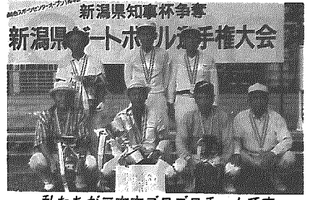
私たちが二本木ゴロゴロチームです

昭和59年、県ゲートボール連盟の結成と同時に横越村ゲートボール協会として発足。 〈発足〉 昭和59年、県ゲートボール連盟の結成と同時に横越村ゲートボール協会として発足。 〈あしあと〉 県連盟に加盟し、県及び各団体の主催する大会に、村代表として参加回数は、12回。全日本ゲートボール選手権大会に出場回数4回、この他世界ゲートボール選手権大会や全国医療生協・健康福祉祭兵庫大会等の全国大会出場経験をもつ。 〈各種大会の入賞回数〉 ・全日本選手権大会 第3位 ・県選手権大会 第3位 ・優勝 2回 ・第3位 2回 ・準優勝 2回 ・下越地区大会 準優勝2回 ・北信越選手権大会 準優勝 ・三市中東大会 優勝 1回 ・準優勝 1回 ・県選抜大会 優勝 1回 ・医療生協県選抜大会 準優勝 1回 ・農協下越大会 優勝 このように、年々全国大会を始め県下各地の大会で力を発揮。 二本木ゴロゴロチームの名前の由来 チームの中には、「仕事もしないで、ゴロゴロしている人の集まり」といっています。が、「ゴロゴロ鳴るカミナリ様のように強い」とユニークな名前とともに競技の強さが全国的に知られている。ここまで、有名になるにはルールやテクニックの練習の積み重ね、チームの和が基本となっている。 ゲートボールのおもしろさ 年齢を問わず、誰でも楽しめるゲートボールは、「明るく楽しく語りあい、親睦と融和をはかる」スポーツです。スポーツ競技には、すべてルールがあり、勝ち負けがあります。 老若男女が平等に競技できるのもゲートボールです。愛好者の輪を大きく広げましょう。