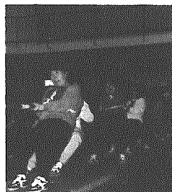
女子優勝 さくら会