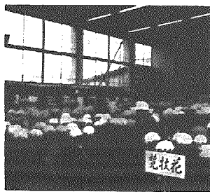
みんな みごとだね

十一月三日・四日の二日間中央公民館主催による文化祭が開催され、大勢の人で賑わいました。