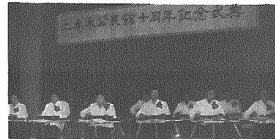
10年を祝う大正琴グループ