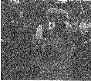
もうすぐ 食べられるよ

風雨の中の十一月四日に開催。訪れた人に豚汁の無料サービスもあり、役員の手作りの味に舌鼓をうっていました。 作品展は、菊、書道、人形、手芸品、生け花などを展示。また、不用品販売などの収益を村に寄付しました。