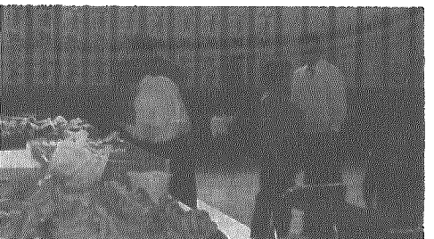
バナナか、野菜いりませんか

晴天の十一月三日に開催。昭和五十六年に公民館ができて今年で満十年を迎え、老人クラブの会員や村、企業、嘱託員などの関係者を招待して記念式典をやり、大正琴、歌謡など祝った。 会場には、福祉機器コーナーや書道、陶芸、生け花などの作品を展示。 また、なし、バナナ、コンニャク、ジャガイモ、里芋なども販売し、終日にぎわっていました。