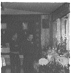
生け花もいいねえ

子供たちのジャンケン大会、もちつき大会にぎわった。作品展としては、生け花、書道、絵、手芸品などを展示。 不用品販売や作品展など —新田公民館—