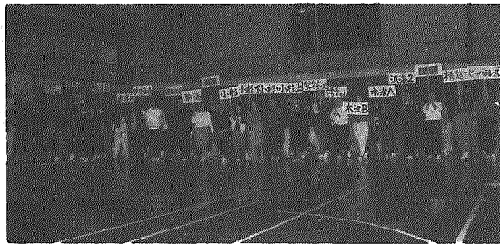
男子17チーム、女子11チームが入場行進