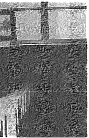
なつかしい写真だね

菊の香る文化の日開催。作品展では、菊花展、書道展、生け花展、子供画展、手芸展など地域の方々の心ももった力作に観る人の足もゆつくりと感嘆の声が添えられていました。