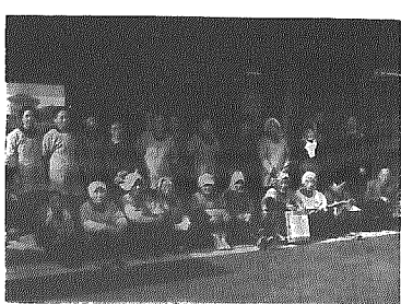
私たちが一美会です