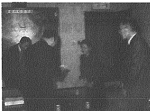
善意をありがとうございます