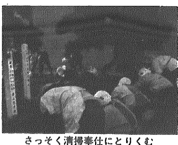
さっそく清掃奉仕にとりくむ