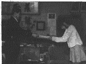
これからも頑張って下さい