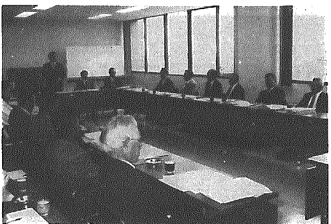
村政推進役の嘱託員のみなさん

平成三年度の嘱託員会議が五月十七日役場で開催されました。 嘱託員は地域の取りまとめ役、住民と役場とのパイプ役として重要な役割を担っています。会議は、会議に出席している村内十九人の嘱託員が出席しました。 村からは村長、助役はじめ各課長全員が出席しました。村長からあいさつと助役からの平成三年度予算の概要及び重点施策の説明、各課業務依頼などが行われ、村行政を円滑に推進するための協力要請がされたほか、ゴミステーションの助成制度や寿橋道路の延長計画などの質議や意見交換が活発に行われました。 また、横越大祭開催日程が十月九日・十日に決まったことから大祭成功に向けての協力依頼がされました。