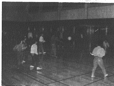
元気いっぱい動きまわる子供たち

地域おこしと地区住民の親睦を図ろうと、小杉地域ドッチボール大会が小杉公民館主催によって行われ、和やかに楽しい試合が連夜にわたって