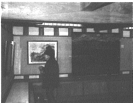
素晴らしい作品が展示されています

横越村の景観再発見事業に村内外からすばらしい作品が多数応募されましたが、その入賞作品を一堂に展示した景観再発見作品展示会が、北方文化博物館屋根裏ギャラリーで二月四日まで開催されています。展示会には、大自然に恵まれた村の四季や魅力を写真、