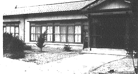
増築された藤山会館

藤山地区の集会所である藤山会館の増築工事がこのほど完成し、十一月十一日に竣工式が行われました。 藤山会館は、昭和五十五年村づくり活動の拠点施設として建設されましたが、諸団体等の活動の活性化に伴い手狭になり、催しにも不便をきたしていたことから増築が強く望まれていました。 今回の工事は、既存施設に新たに十八畳の広さの和室と廊下を増築したもので、総工