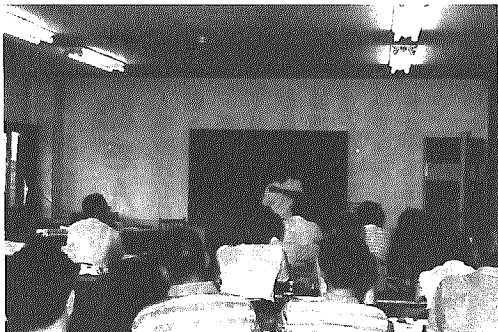
講演を熱心に聞く参加者のみなさん

川風景を撮り続けたスライドを見ながら、露出の決め方などの専門的な技術指導を受けけるなど、一日熱心に学んでいました。