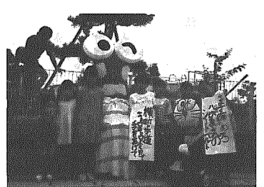
児童たち製作のかかしも参加

交通量の多い県道横越・新潟線(赤道)と村道五十七号線の役場裏交差点に、このほど夜間点滅する自発光式交差点標が設置されました。