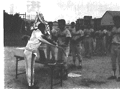
横越村農協チームに優勝旗が渡される

生け花展は、川根谷内地域公民館の生け花教室の会員十名が出品。これまでの練習の成果が発表され、華やかな生け花が二階ロビーに展示されました。