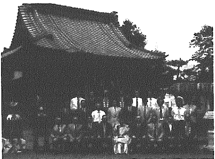
みこし奉納式での関係者のみなさん

小杉公民館では、これまでも祭りなどを通じて地域おこしを積極的に進めてきましたが、