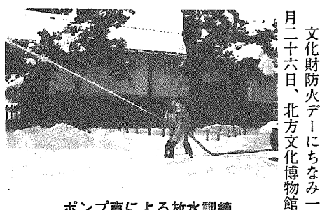
ポンプ車による放水訓練

文化財防火デーにちなみ二月二十六日、北方文化博物館で防火訓練が行われました。北方文化博物館には、国文化財や県文化財のほか貴重な書、絵画、彫刻類などが多く所蔵されており、毎年訓練が行われているもので、この日は、入口付近から出火という想定で、消防団の第二分団が出動し、ポンプ車による本番さながら機敏な放水訓練が展開されました。 このあと、職員のみ消防器による初期消火訓練や館内消火施設のきめ細かな点検が行われました。