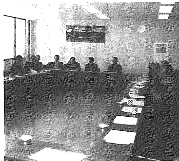
魅力ある地域振興をと説明会

個性的な地域振興を図るための資金を交付するもので、二千万円のうち九百万円が均等割(各百万円)で、一千万円が人口割でそれぞれ配分され、年度内に交付することになっています。(各地域公民館の交付額は別掲のとおりです。) 事業実施にあたって