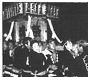
新しく作られた万燈神輿

八月下旬を中心に村内各地で秋祭りが行われましたが、八月二十六日、二十七日の小杉地区の秋祭りでは、新しい万燈神輿が作られ盛大に行われました。