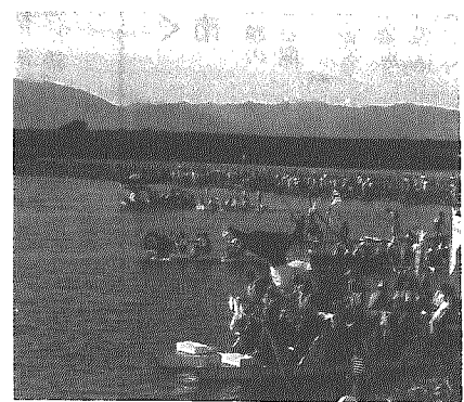
阿賀野川舟下りに23隻

製作アイデアとスピードを競う第五回阿賀野川自作の舟下りレース(同実行委主催)が七月三十日、沢海床止めから新潟市松浜橋までの延長十五キロの区間で行われました。 同レースは、昭和六十一年の国際青年年から阿賀野川の自然を守り、流域の交流を広げるイベントとして、新潟市や横越村の青年たちの手によって開催されてきているもので、今年も近隣市町村から二十三チームが出場。村内では第一回から参加している横越下漂流丸V世が参加しました。 当日は、晴天にめぐまれた夕風の追い風という好コンディション