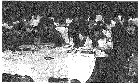
大人への自覚を新たにする新成人のみなさん

製作アイデアとスピードを競う第五回阿賀野川自作の舟下りレース(同実行委主催)が七月三十日、沢海床止めから新潟市松浜橋までの延長十五キロの区間で行われました。 同レースは、昭和六十一年の国際青年年から阿賀野川の自然を守り、流域の交流を広げるイベントとして、新潟市や横越村の青年たちの手によって開催されてきているもので、今年も近隣市町村から二十三チームが出場。村内では第一回から参加している横越下漂流丸V世が参加しました。 当日は、晴天にめぐまれた夕風の追い風という好コンディション