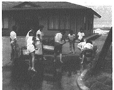
老人福祉センターに花を設置する児童たち

このほど、美しい環境づくりに役立ててもらおうと、横越小学校児童が育ててきた花のプランターが、老人福祉センターとAコープ横越店前バス停に設置され、施設利用者らから大変喜ばれています。