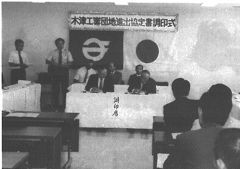
進出19企業と協定書に調印

村の活性化を図るため、農・工・商の併立をめざす重点施策として、村では木津地区に工業団地を造成するとともに、企業誘致を進めてきましたが、七月二十四日、同団地への進出を決めている十九社(別掲)の企業と横越村との進出協定書の調印式が、役場で行われました。