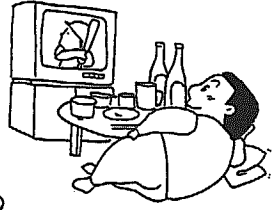
1つ1つがこれだけごはん 軽く6分目(110g=160キロカロリー)です。

夏ノスイカ・トウキビ・冷たいビールがおいしい季節になりました。でも、食べすぎてはいませんか? 夏は暑さのために食欲もなくなり、口あたりの良いものばかりを食べがちになります。そのために栄養のバランスがくずれて、夏バテ・夏やせなどを引きおこします。