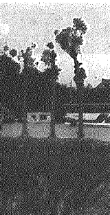
木津工業団地からはざ木を移植(北方文化博物館)

このように人気の高い博物館ですが、文化観光に偏っているため、やや大人向けであり、女性を主として徐々に若者が増えて来ています。若い層に若者や、家族づれにとつてはあまり大きな魅力のある観光施設となっていない。そのため、北方博物館を中心とする「豪農の館めぐり」は今後も、人気が一時的に続くことと見込まれるものの、人気の高い弥彦を中心とした観光ルートとの組合せや、温泉ブームで人気の高い月岡温泉などとの組合