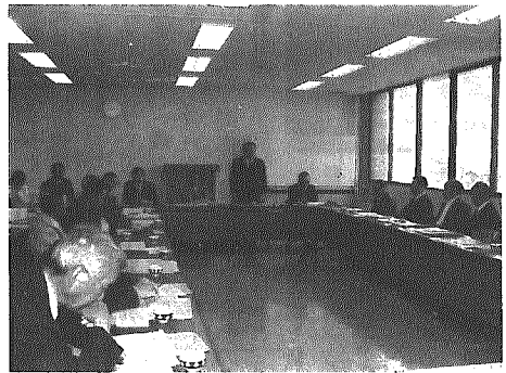
村政推進役の嘱託員のみなさん

平成元年度の嘱託員会議が四月十九日役場で開かれまし た。会議には、村長以下各課長が出席し、村から平成元年度予算の概要及び重点施策、ふるさと創生、役場機構、各課業務依頼などの説明がされたほか、村事業の円滑な推進に協力を要請しました。 一方、嘱託員側からは、道路整備、側溝整備、小阿賀堤防の除草、二本木スクールバス停の設置な