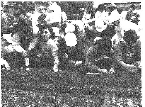
熱心に植付け作業をする児童たち