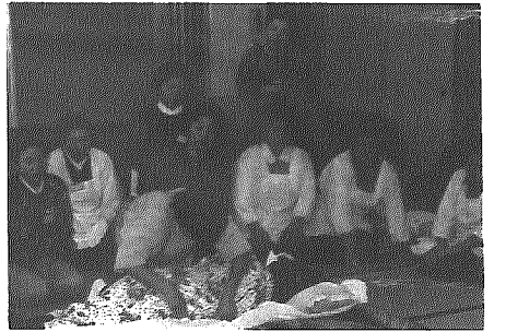
保健婦の実演指導をうける参加者

高齢化社会に向け、介護知識や技術の普及と地域における相互援助の基盤づくりをめざす家庭看護教室が、三月八日と十五日の二回にわたって老人福祉センターで、家庭の主婦ら三十名余りが参加して