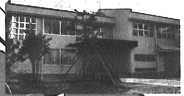
老人福祉センター増設