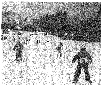
初心者スキー講習会も行われた

さる一月二十九日、村体育協会主催による村民スキーの集いがわかぶな高原スキー場で開かれました。