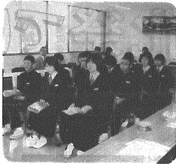
表彰を受けた入選者のみなさん

を支持して意欲的に学習に取り組ませる指導」と題した発表が行われました。 この後、一限の公開授業などを課題に十一分科会が開かれ、熱心な討議が行われ、これらを受けて、県教育庁安藤