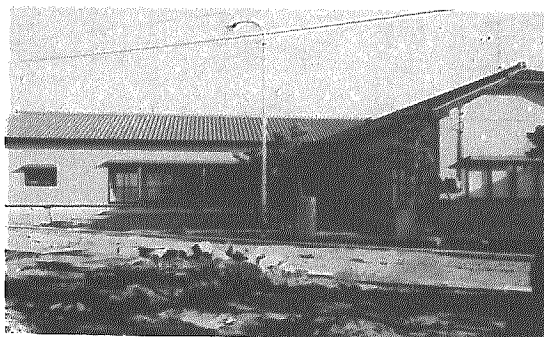
新田地区コミュニティセンター

この新田地区コミュニティセンターは、中央区画整理組合が造成した公園が隣地にできたため、農協第一団地の公園を村より借用し建てられ、木造平屋建て、床面積約二百九十一平方メートル、総事業費は約二千八百万円。村と駒込田郷地域センターからの補助金や中央土地地区画整理組合負担金のほか、自己資金の一部を県の自治振興資金貸付事業より一千万円借入れ建設されました。