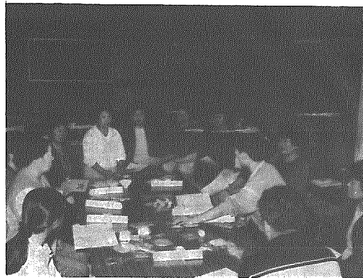
食事指導に熱心に聞き入る

今年も、二十三名が参加して九月二十二日、自分の身体状況把握をするために、採血、皮厚測定、問診などを行い、個々の調査結果表が新 津保健所によってつくられまして、十月二十二日には、調査結果に基づき個人指導と減量のための食事や運動のしかたなどの講習のほか、各自が目標体重の設定をするなかで、具体的な日常生活のプログラムづくりが行われ実践していきくとになりました。 今後は、さらに減量のための実践方法の講習のほか、各自が