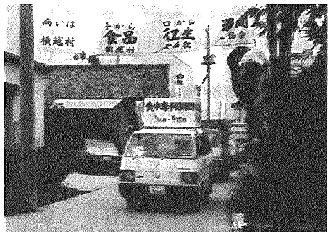
村内パレードする街宣車

夏場の高温多湿の気候は、食中毒になる細菌が繁殖しやすい、食品の衛生的な取扱いは、