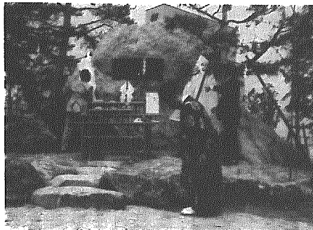
竣工記念碑の除幕式

横越中央土地区画整理組合が、昨年五月より進めてきた土地区画整理事業の造成工事が、このほど完成し、同事業を記念して建立された竣工記念碑（四国青石・二十五、浅見村長揮毫）の除幕式と竣工式が六月二十日、浅見村長ほか多数の来賓と地権者ら百五十名余りが出席して盛会に行われました。