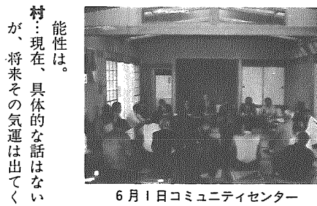
6月1日コミュニティセンター

計画の説明が行われ、地区の協力要請がされました。このあと、村政の問題点や地域課題についての意見交換が行われました。（小杉会場16人） 1：大阿賀橋の進捗よく状況は。 村：今年度は橋脚三本の予算が付いている。今後、取付道路の関係で買収の可能性があるが地元住民の協力をお願いしたい。 2：新潟市との町村合併の可能性は。 村：現在、具体的な話はないが、将来その気運は出てくるものと予想される。