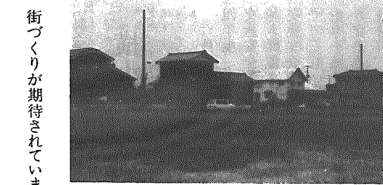
住宅が建ち団地の様相に

この宅地造成は、役場庁舎周辺十一、二（一）に二百五十区画を宅地とした大規模なもので、区画街路・上水道・公共下水道・都市ガスなど快適な生活環境が整備され、立地条件にも恵まれた優良住宅団地となりました。