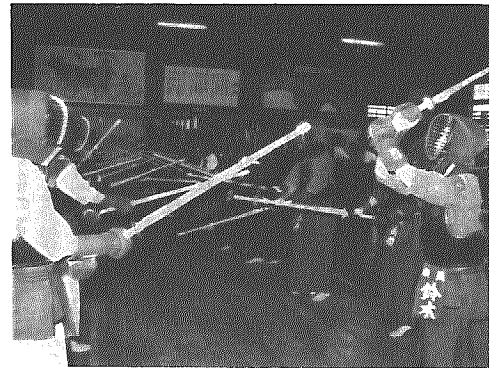
武道館として新たにスタート

村では地域公民館設置により木津分館が廃止されたのに伴い、旧体育館を武道館として活用していくことになりました。武道館は主に銃剣道で使用され、利用申し込みは横越村公民館で受け付けています。郷土資料館は農具、漁具、生活具など六百点余りが二室と廊下に展示されており、あらかじめ横越村公民館に申し込みのうえでも観覧できるようにしています。