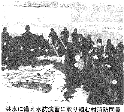
洪水に備え水防演習に取り組む村消防団員

阿賀野川水防演習が六月十二日、京ヶ瀬村嘉瀬島地先の阿賀野川河川敷で三百五十人余りの消防団が参加して、大掛りの訓練が行われました。 この演習は、阿賀野川工事事務所や流域八市町村で行っている阿賀野川水防連絡会など主催で、毎年梅雨どきの出水期を控え、水防技術向上