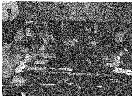
竹とんぼづくりにみんな真剣に取り組む