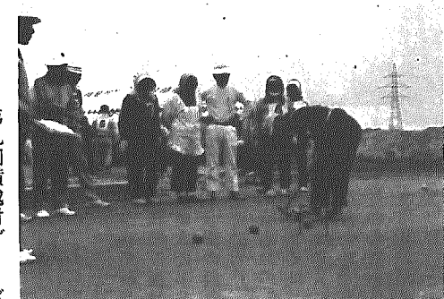
強風のなかで熱戦が繰り広げられる