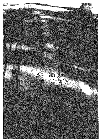
村の文化財に指定された八幡宮幟

村の文化財新たに一件指定 八幡宮(小杉)の幟一組 横越村文化財調査審議会において検討され、村教育委員会に意見具申されておりました小杉八幡宮の「八幡宮幟」が、四月十二日の村教育委員会で村文化財第六号として指定されました。