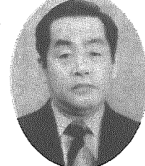
講師 酒井 広氏 (日本テレビアナウンサー)