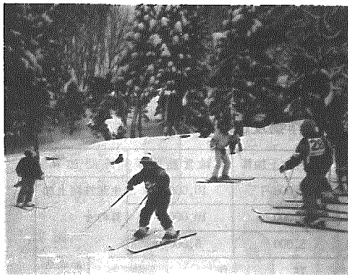
スキークラブ員の指導をうけ練習する参加者

さる一月三十一日、恒例の村民スキー教室が「わかぶな高原スキー場」で開かれました。今年度のスキー教室は、暖冬 でスキー場の雪が少なく心配されていましたが、直前にようやく雪も降り主催者がホッと一息つく場面もありました。当日は幼児から一般まで含め八十六名が参加するという盛り上がりようで、参加者は、今シーズン開設された新しい施設が整っているうえ、初めて滑るコースでの感触を味わいながら思い思いに楽しんでいました。初心者を対象にして行われた