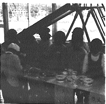
園児たちのかわいいお店屋さん