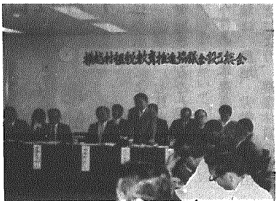
役場で開かれた設立総会

租税の意義、役割、租税制度の仕組みなど正しく理解してもらい、住民一人ひとりに納税に対する意識を高めていただくこと、横越村租税教育推進協議会が設立され、その総会が六月十九日役場で行われました。