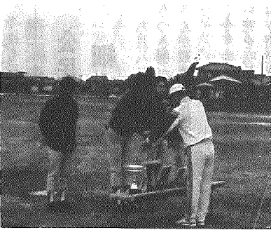
優勝旗を受ける農協チーム

梅雨空の時折小雨降るなか午前六時から横中グラウンドで行われた決勝戦は、横越農協が二回にランニングホームランなどで四点を先取。その後