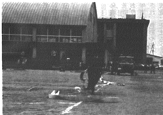
きびきびと日頃の練習の成果を披露

三市中蒲地区支会の連合消防演習が六月十四日、横越小学校グラウンドで開かれました。