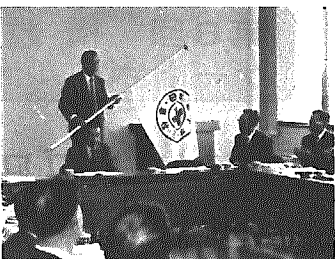
発足式で県支部より団旗を受ける

日本赤十字社新潟県支部では昭和六十一年度から五ヶ年計画で赤十字地域奉仕団の結成を促進しており、本年は県支部が明治二十年十一月に創設されてから百年目にあたり、いろいろな記念事業を計画しています。横越村分団では、これらをつまえて、百年目にあたる年に横越村赤十字地域奉仕団を結成すべく、昨年から区長等