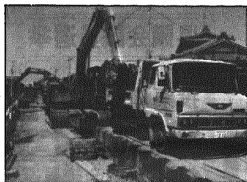
公共下水道事業 <継続>