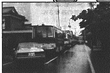
51号道路(博物館駐車場連絡道路・村単)