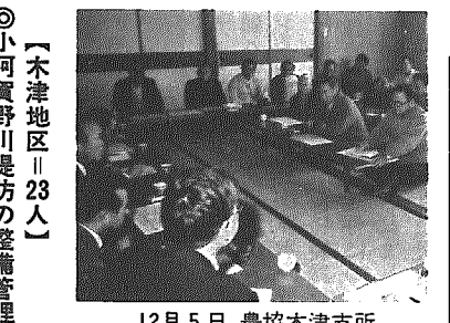
12月5日 農協木津支所

地区がかかえている問題を村と地区住民がひざを交え語り合う村政懇談会が五地区で開かれました。