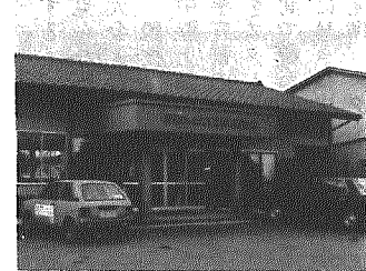
阿部木材工業株事業所

阿部木材工業株は、労働省が毎年実施している毎月勤労統計調査事業所に、昨年四月より指定され調査報告を行ってきたもので、県下常用労働者三十人以上を雇用する四百二十四事業所が対象となつて