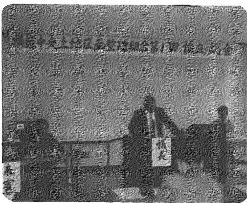
横越中央土地区画整理組合設立総会

の安全を図るように計画されているほか、公園二ヶ所、緑地二ヶ所、上水道やガス供給施設外下水道をも整備し将来人口九百人を目標にする計画で、事業期間四ヶ年、総事業費七億五千万円規模となっています。