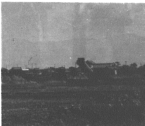
宅地造成工事はじまる