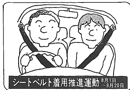
シートベルト着用推進運動 8月1日 9月20日