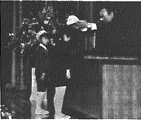
新入学児童代表に安全帽を交付

四月七日の小学校入学式において、新入学児童一三三名に黄色い安全帽が交付されました。