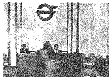
施政方針を述べる村長

三月定例会で昭和六十一年度の予算が決められました。これまでに、新庁舎や小杉保育園の建設及び中学校グラウンド用地取得など、累年の課題であった事業が一段落したと、厳しい財政事情のもと昭和六十一年度予算は、国家予算以上に超緊縮型となりました。