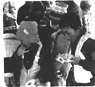
おいしそうに食べる子どもたち

さる一月二十六日、恒例の村民スキー教室が五日町スキー場で開催されました。当日は、幼児から一般を含め六十四名が参加。雪が一日中降り続けるというあいにくの天候でしたが、午前中は、初心者を対象に村内スキークラブ員によるスキー技術講習会、午後からは、もちつき大会などが行われ、親子で楽しい一日を過ごしていました。子どもたちにとっては、スキーもさることながらもちつき大会が好評で、重い杵を慣れない手つきでつく姿にさかんに