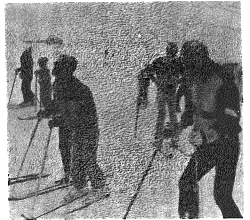
ゲレンデでのもちつきも好評