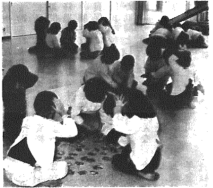
可愛い手で「ハイッ」

一月に村内各保育園で、カルタ大会が開かれました。双葉保育園では九日、ばら組のカルタ大会が広い遊戯室で、三十四人の園児たちが五