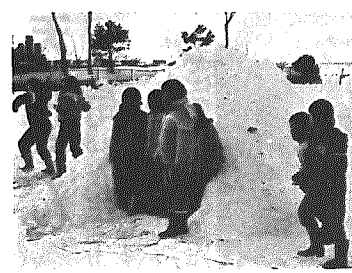
子どもたちは雪が大好き

横越地区では、子どもたちから小正月の一日を楽しく過ごしてもらおうと、いまでは懐しくなったかまぐらづくりやもちつき、雪合戦なども企画。 子どもたちは、午前十時に集合し駒込農道脇の田んぼで、始めてつくるかまぐらに、親たちからも手つだつてもらい