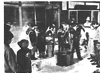
楽しいもちつき大会