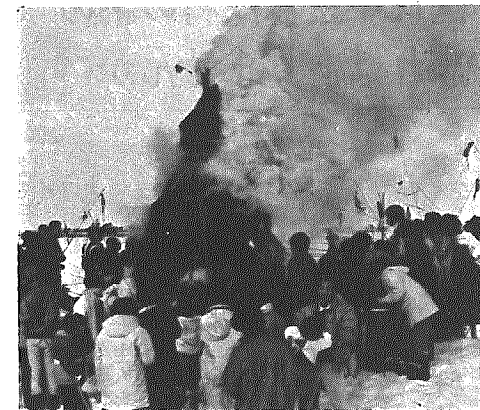
燃え上がる「さいの神」みんな大はしゃぎ

小正月の十五日、「さいの神」が今年も横越下、沢海、木津、小杉地区(二本木地区は十二日)で、青少年育成村民会議支部などによって行われ、多勢の親子が参加する盛況ぶりでした。