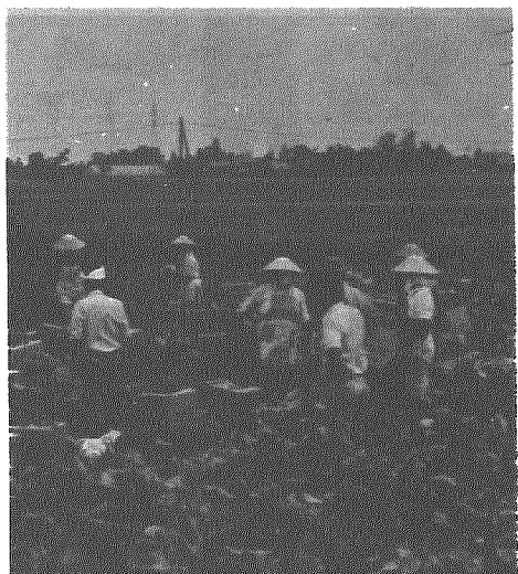
大麦と夏秋キャベツの集団化ほ場で夏秋キャベツの収穫(昨年、木津地区)