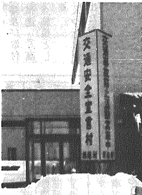
役場前に設置された交通安全宣言看板

昨年、村では交通事故の防止に一層努力すべく「交通安全の村」の宣言をしました。その一環として、役場前に交通安全宣言立看板が設置されました。新年を迎え、心も新たに安全運転を心がけ交通事故"ゼロ"をめざしたいものです。