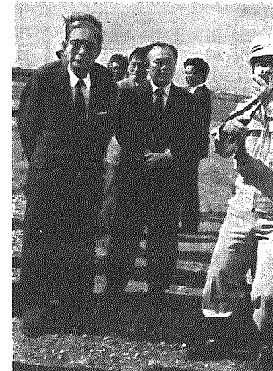
国道横雲バイパスの現地を訪れた木部建設大臣

東北振興幹線道路建設促進大会に出席した木部建設大臣は、十月六日国道横雲バイパスの現地を訪れた際、浅見横越村長や京ヶ瀬村長など国道四十九号線バイパス建設