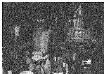
今年から行われた樽みこし

どおり活気にぎわいに満ちた近來にない村祭りとなりました。その中でも、今まで商工会青年部が中心になり、子供たちの樽みこしを続けていたが、小杉地区住み良い村づくり推進協議会が結成された機会に、地区の有志で祭友会をつくり、宵宮に樽みこしを出し、翌日には子供みこしでにぎわい、お年寄りの方から子供たちまでみんなが祭りを楽しみました。