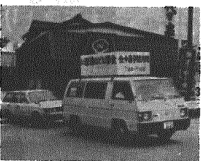
村内一週する食中毒パレード