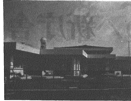
ギザギザが特色の小杉保育園

遊戯室を中心に左右に保育室二、乳児室、事務室、医務室、調理室などがあり、遊戯室は床下暖房となつています。屋外遊戯場にはプール、ブランコ、鉄棒、雲梯子、ジャングルジムを備えたテラスなども。また、建物の造りが