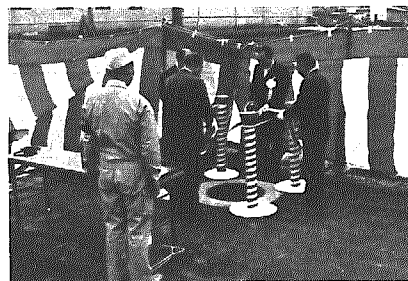
公共下水道通水テープカット