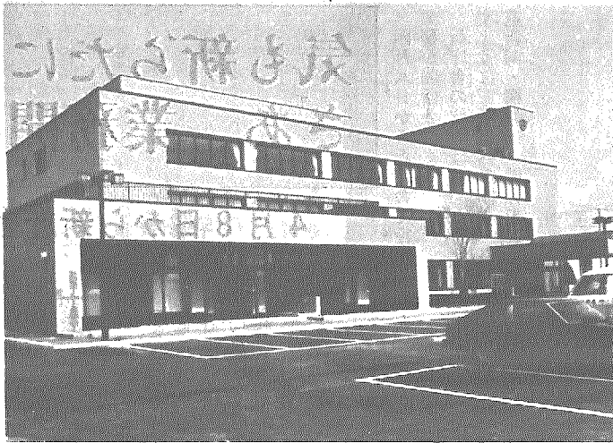
新 庁 舎

昭和58年11月から建設工事が進められてきた役場庁舎が完成し、4月8日から新庁舎で業務を行うことになりました。