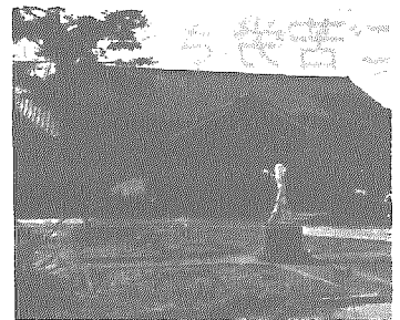
老朽著しい小杉分館にかわって、コミュニティセンターの建設が予定