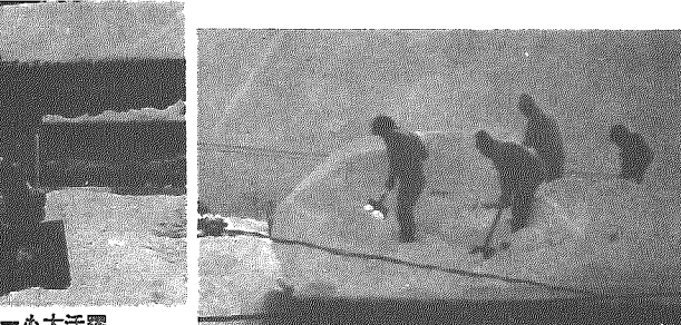
人夫を雇い、雪下しする家も