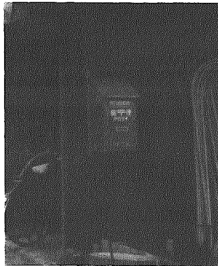
長年の念願かない設置された郵便ポスト

焼山地区に、このほど地元の人たちの長年の念願であった郵便ポストが設置され、喜んでいきます。 焼山地区の人たちは、これまで手紙やはがきを出すにも隣接の京ヶ瀬郵便局や、登校の中学生に頼んで横越郵便局に投函するなど不便をしてきました。 地元では、会合のあるたびにこの話が出、二年前横越